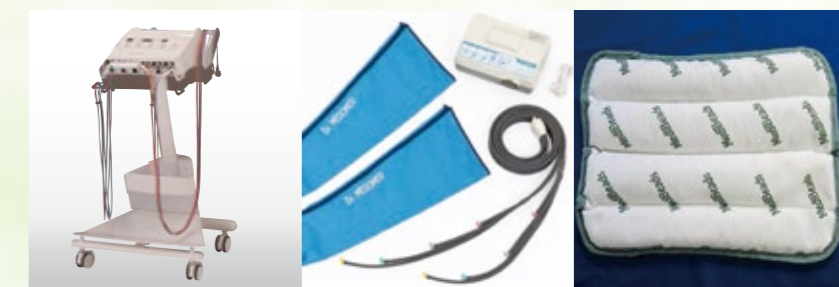
低周波治療器 (痛みの緩和) メドマー (むくみの軽減) ホットパック (筋肉のコリを軽減)