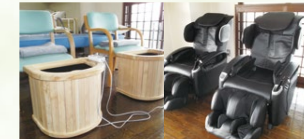
足岩盤浴 (血液循環促進) マッサージチェア (疲労回復)